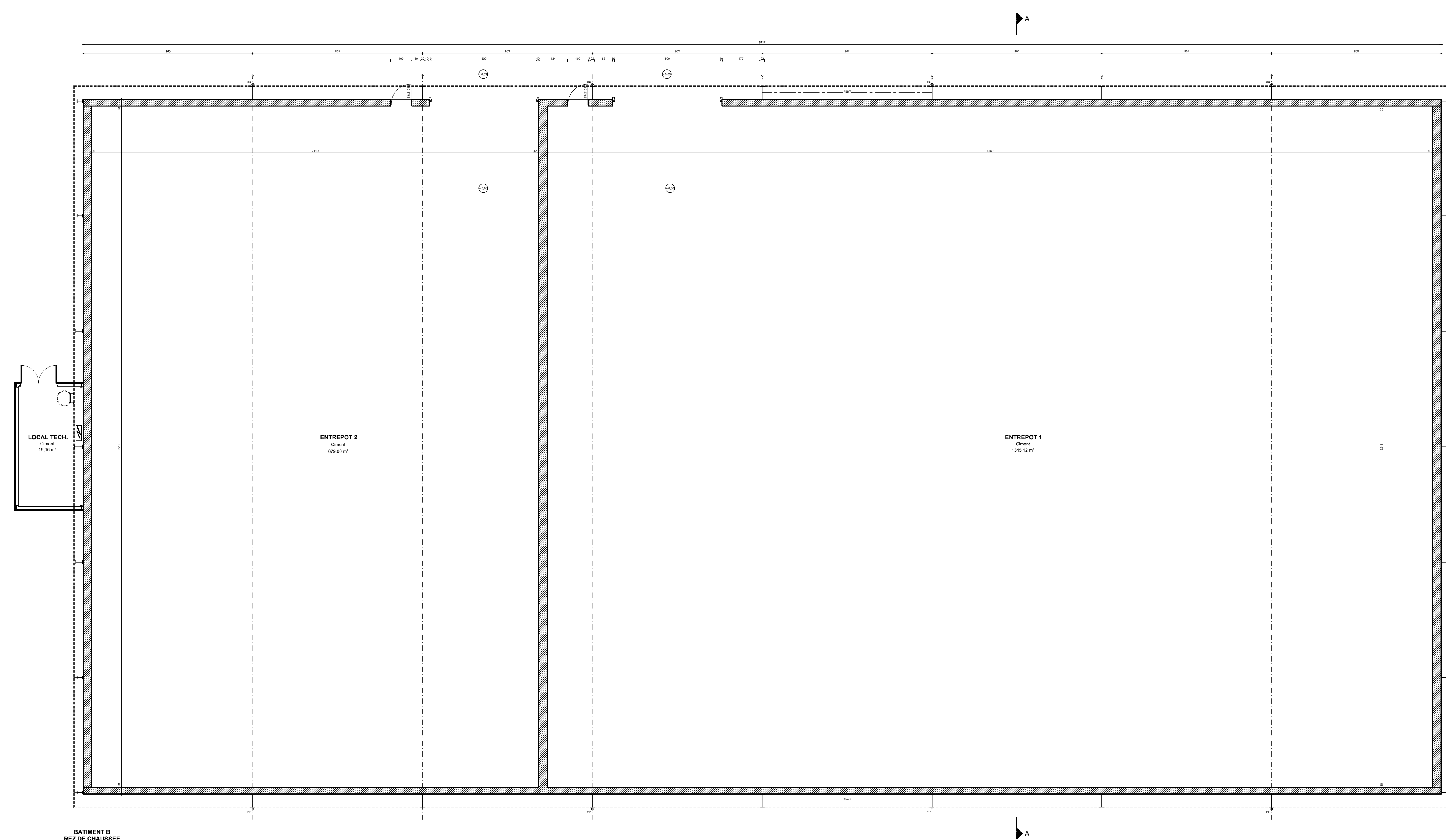
BATIMENT B REZ DE CHAUSSEE